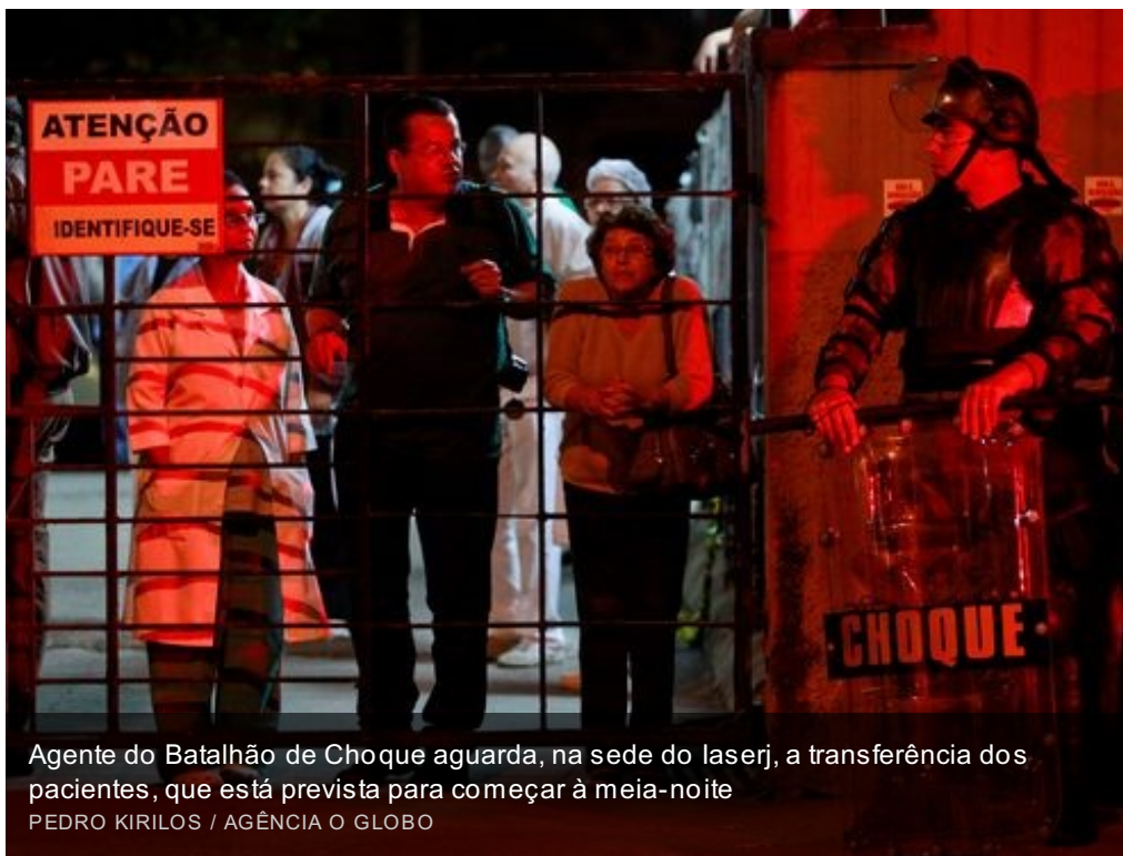
Agente do Batalhão de Choque aguarda, na sede do laserj, a transferência dos pacientes, que está prevista para começar à meia-noite