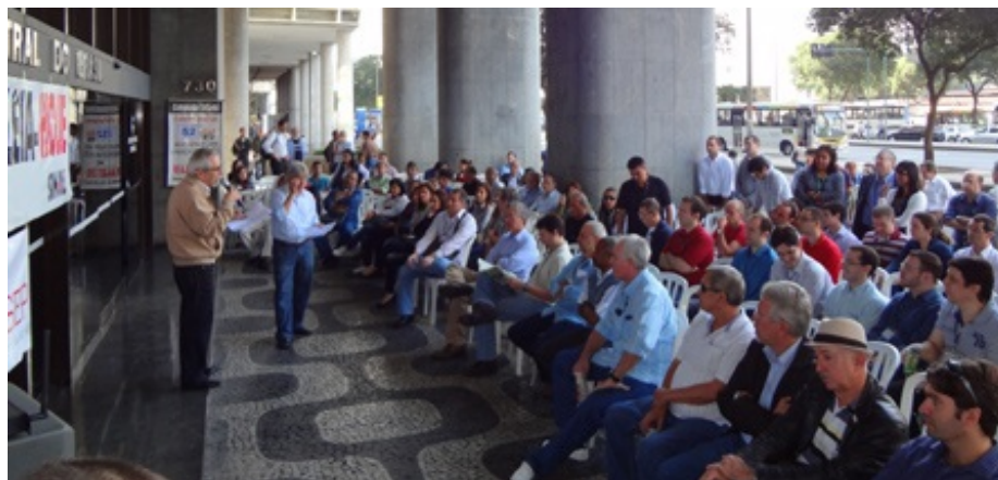
Assembleia do dia 11.7.2012

Como sabemos, a campanha não começou nem terminou ontem, e deve se acirrar no mês de agosto, caso o Governo continue fazendo "cara de